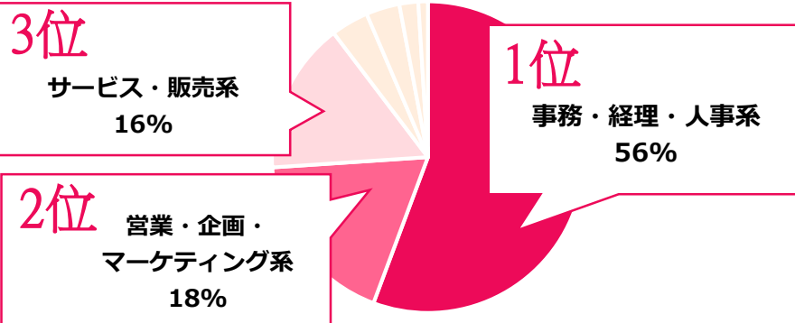
▼サービス・販売系職種経験者の応募先職種