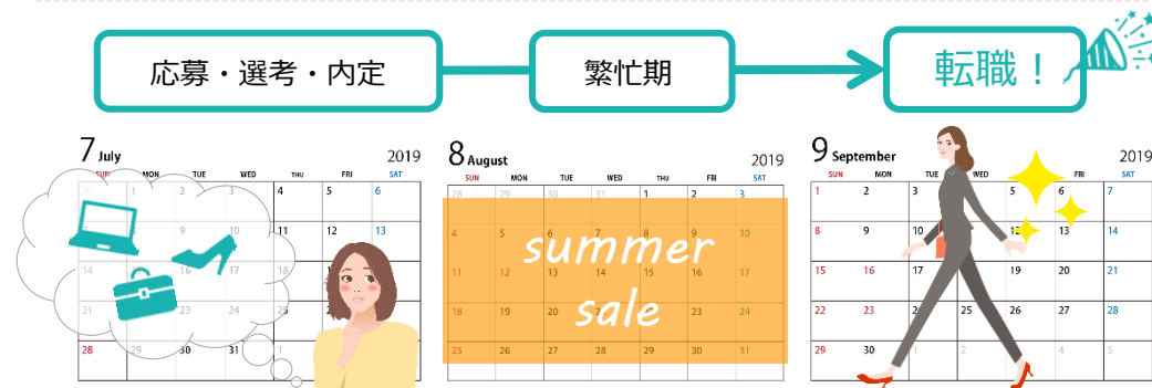
▼繁忙期後の転職を目指した、よくある転職活動スケジュール

今は、夏の繁忙期が落ち着いた後の退職・転職先への入社を目指して 転職活動をしている人が多い時期なので、 採用に適したタイミング です！